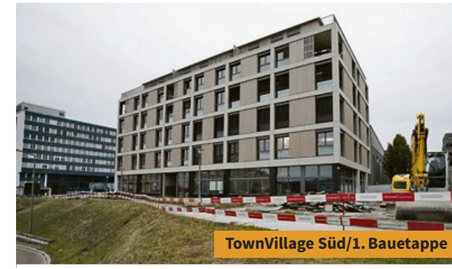
TownVillage Süd/1. Bauetappe